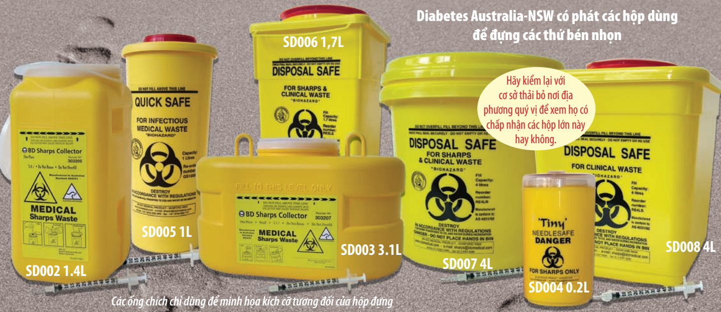
Các ống chích chỉ dùng để minh họa kích cỡ tương đối của hộp đựng

Hãy kiểm lại với cơ sở thải bỏ nơi địa phương quý vị để xem họ có chấp nhận các hộp lớn này hay không.